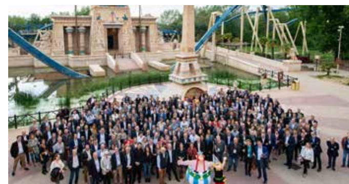
Rencontres 2019 - Parc Astérix

Les Rencontres du SNELAC se déroulent chaque année dans un site adhérent.