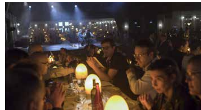
Dîner de gala 2018 - Puy du Fou

Les séminaires thématiques font intervenir des experts sur des problématiques transverses d'exploitation. Une approche transversale sous l'angle de la sécurité et du social permet d'analyser des sujets au niveau opérationnel, tactique et stratégique.