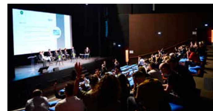
Séminaires thématiques 2019 - Parc Astérix

Les séminaires thématiques font intervenir des experts sur des problématiques transverses d'exploitation. Une approche transversale sous l'angle de la sécurité et du social permet d'analyser des sujets au niveau opérationnel, tactique et stratégique.