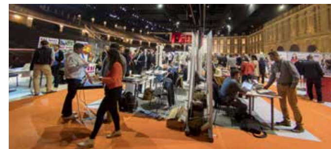
Workshop 2018 - Puy du Fou

Le Workshop du SNELAC est réservé au développement de liens avec les partenaires qui proposent produits et services. Ils présentent leurs activités aux adhérents qui découvrent ainsi l'offre existante répondant à leurs attentes.